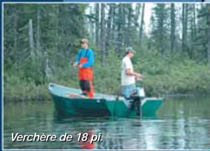
Verchère de 18 pi.