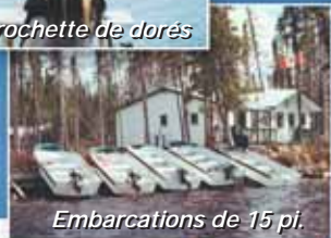
Embarcations de 15 pi.