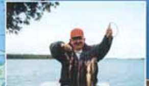
Une brochette de dorés