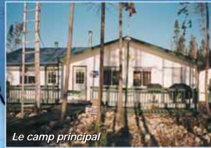
Le camp principal