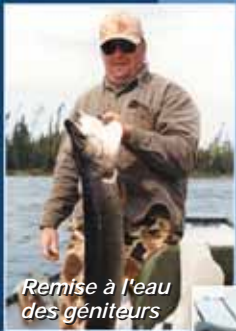
Remise à l'eau des générateurs