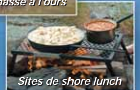
Sites de shore lunch