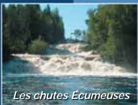
Les chutes Écumeuses