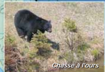
Chasse à l'ours