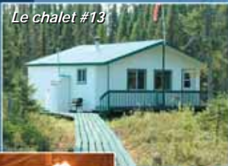
Le chalet #13